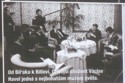
Od Bil'aka k Billovi. Dřívejší disident Václav Havel jedná s nejbohatším mužem světa.

dostat příští rok. Publikum v nedýchatelném vzduchu vydrželo až do konce.