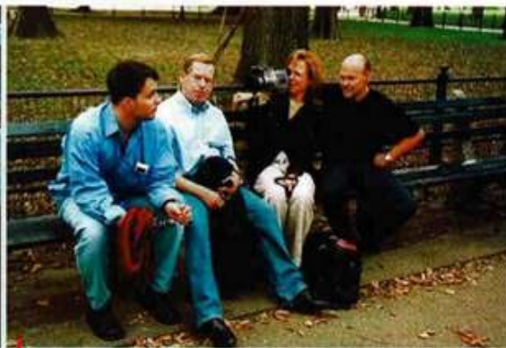
Někdy s natáčením pomohli rodinní příslušníci...

moc mocných. Dalším tématem byla politika a média. A možná především Havel jako dramatik, divadelník a režisér, který s touto zkušeností dál „režuruje“ věci kolem sebe a také svět politiky vnímá z nadhledu jako absurdní drama, v němž sám hraje.