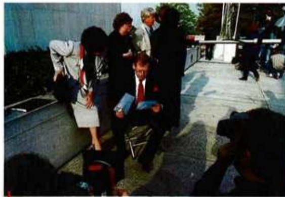
Tak co máme ve scénáři? Lou Reed, lidovci, možná přijde i Klaus.

Především mám pochyby, zda je možné něco narušit. Ale Havel tam nedělá nic potupného